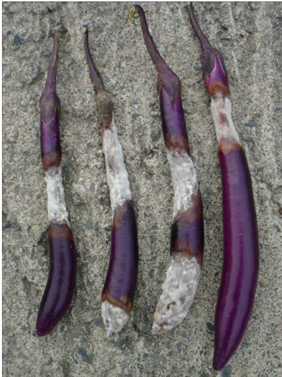
連日豪雨易造成疫病大發生，圖為茄子果實感染疫病之情形。