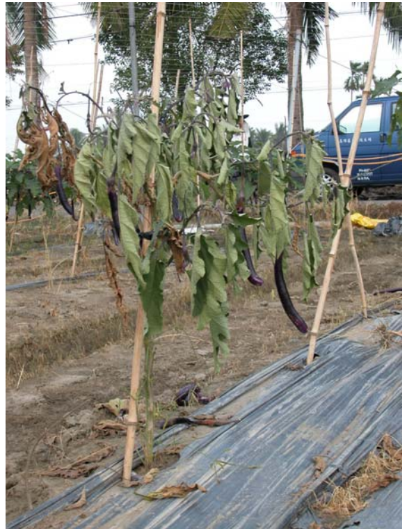
茄子植株罹患青枯病之情形，葉片出現萎凋症狀，最後全株呈青色枯死。