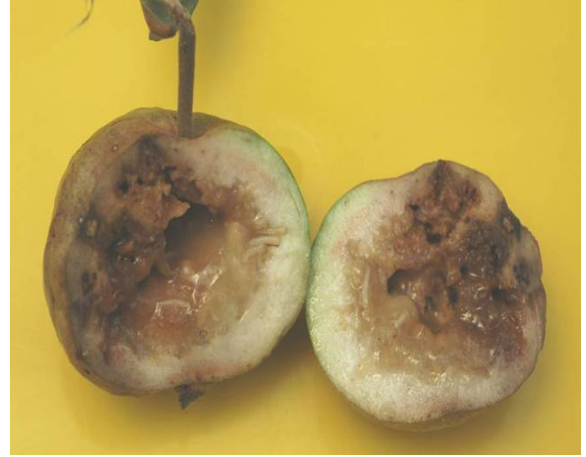
芭樂受東方果實蠅幼蟲危害狀