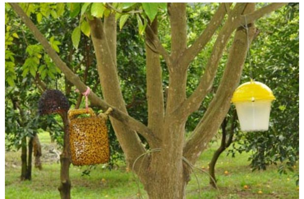
以長效型誘殺器及黃色黏膠防治果實蠅