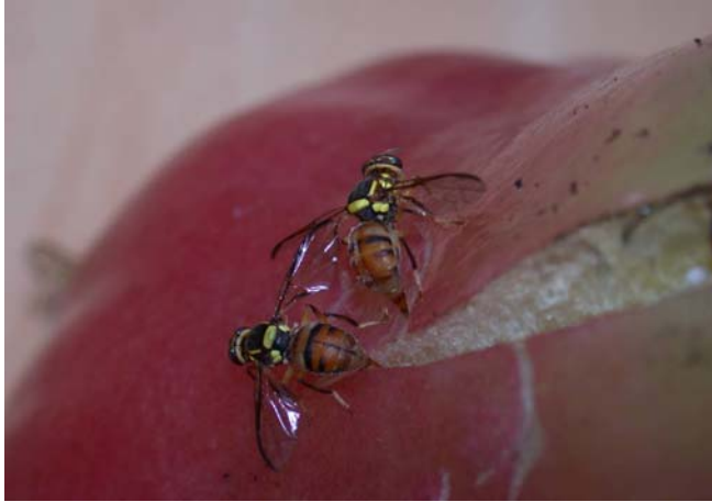
東方果實蠅危害蓮霧狀